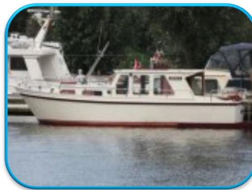
Swancreek 1050 OK.

Ook de "bijzondere hydraulische stuurinrichting" maakte rare geluiden. En de homokineet achter de koppeling was van eigen fabrikaat met garantie tot om de hoek. Het geheel was bijna niet te veranderen/repareren zonder de halve boot te slopen. Het geheel was voor ons daarom niet acceptabel en ook verder van de koop afgezien. Hebben we ook geen goed gevoel aan overgehouden, mede door de houding van de makelaar !