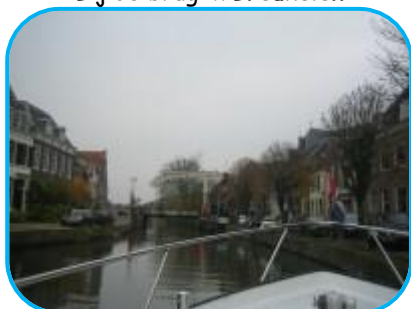
Bij de brug in Maarssen