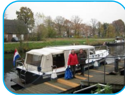
Passantenhaven Vianen bij ons huis